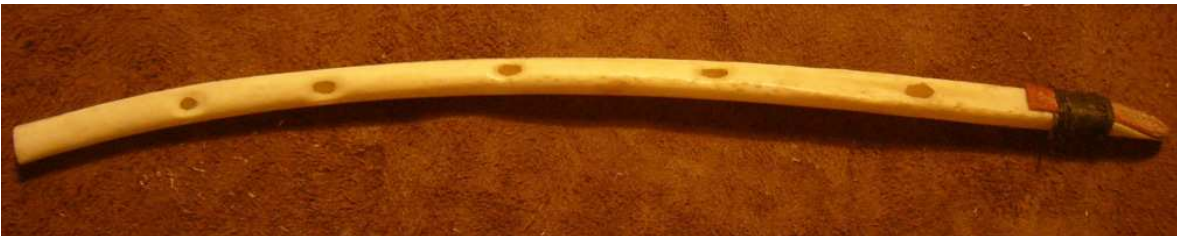
Fig. 2. Resonador tubular hecho de hueso de buitre y lengüeta de corteza de abedul. Foto y modelo experimental de Jean-Loup Ringot. 22 cm de largo.

“Clarinetes” o resonadores tubulares similares pueden construirse con restos de otros materiales orgánicos, hasta para analizar propuestas sobre hipótesis de uso y funcionales de tubos antiguos recuperados. Por ejemplo, Jean-Loup Ringot (2011) dio un taller para modelarlos con lengüeta en base a los tubos prehistóricos (de más de 35,000 años) de hueso con perforaciones, que fueron encontrados en las excavaciones de Nicholas Conard en la cueva “ Hohle Felts ” al sur de Alemania en 2008 (Fig. 2).