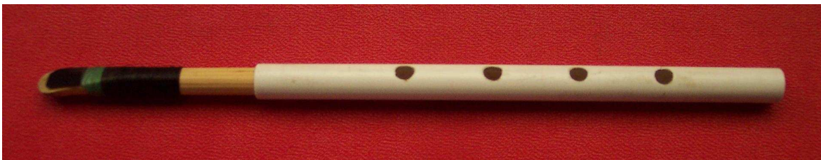
Fig. 1 Resonador de lengüeta. 17 cm de largo.

El objeto de este documento es mostrar que hasta con materiales de desecho, de los que se tiran a la basura, es posible construir modelos experimentales de resonadores efectivos, si se sabe cómo hacerlo. También pueden hacerse de restos de materiales orgánicos. El ejercicio también sirve para demostrar que es posible publicar documentos singulares de cada uno de los más de mil modelos experimentales de resonadores que he podido hacer.