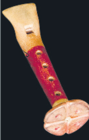
► Velázquez hizo cientos de réplicas de instrumentos, principalmente de barro, carrizo y roca.